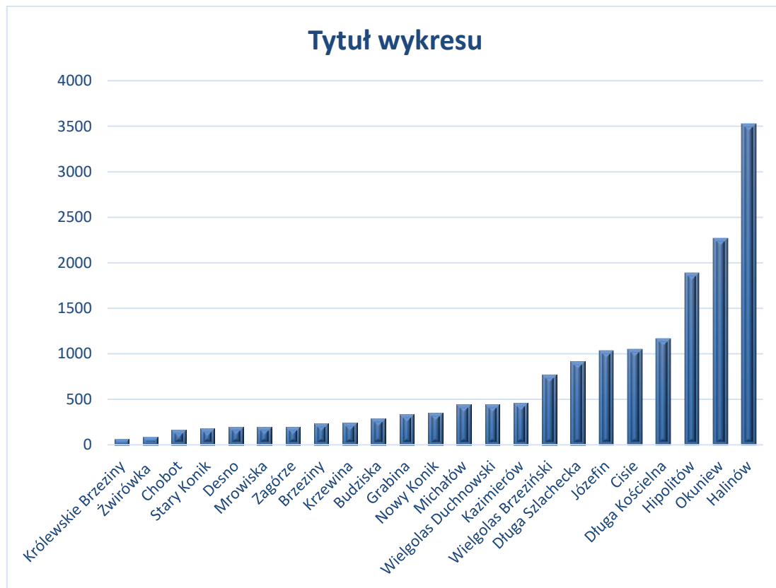
Rys. 1 Liczba mieszkańców Gminy Halinów wg. miejscowości (stan osób zameldowanych na dzień 31.12.2025 r.).

Na terenie Gminy Halinów w 2025 r. zamieszkiwało 16 465 osób (stan osób zameldowanych na dzień 31.12.2025 r.).